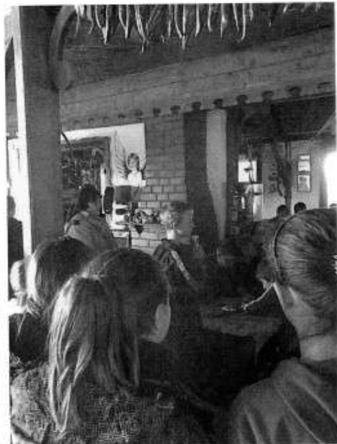
Színvonalas előadásokat hallhattunk a 7.a osztályos tanulóktól