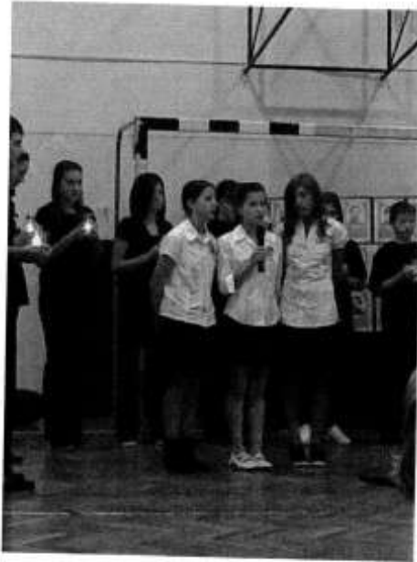
A 8.a osztály ünnepi műsora

Őszi napnak mosolygása, Őszi rózsá hervadása, Őszi szélnek bús keserve Egy-egy könny a szentelt helyre, Hol megváltott - hősi áron - Becsületet, dicsőséget Az aradi tizenhárom. Az aradi Golgotára Ráragyog a nap sugára, Oda hull az őszirózsza, Hulló levél búcsú csókja; Bánat sír a száraz ágon, Ott alussza csendes álmát Az aradi tizenhárom. Őszi napnak csendes fénye, Tűzz reá a fényes égre. Bús szívünknek enyhe fényed Adjon nyugvást, békességet; Sugáridőn szellem járjon, S keressen fel küzdelminkben Az aradi tizenhárom.