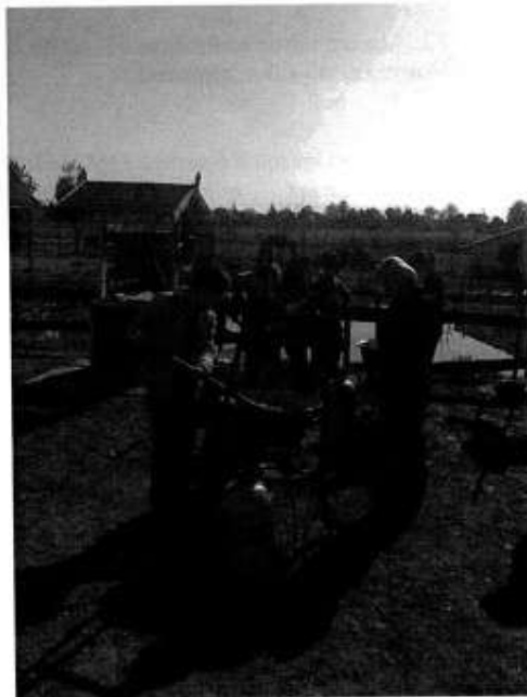
Tanáraink gulyást főznek

A délelőtt kellemesen telt, hisz az időjárás is kegyes volt hozzánk. Szikrázó napsütésben telhettek a programok, így azt hiszem mindnyájan várjuk, hogy a jövő tanévben is megrendezésre kerüljön egy hasonlóan érdekes Comenius-nap.