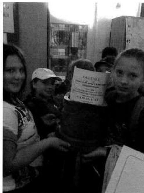
Teljesítettük a távot